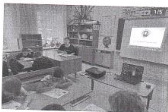
Рис. 7 «Пушкинский диктант»

Дети, посещающие школьный лагерь дневного пребывания, приняли участие в международной просветительной акции «Пушкинский диктант».