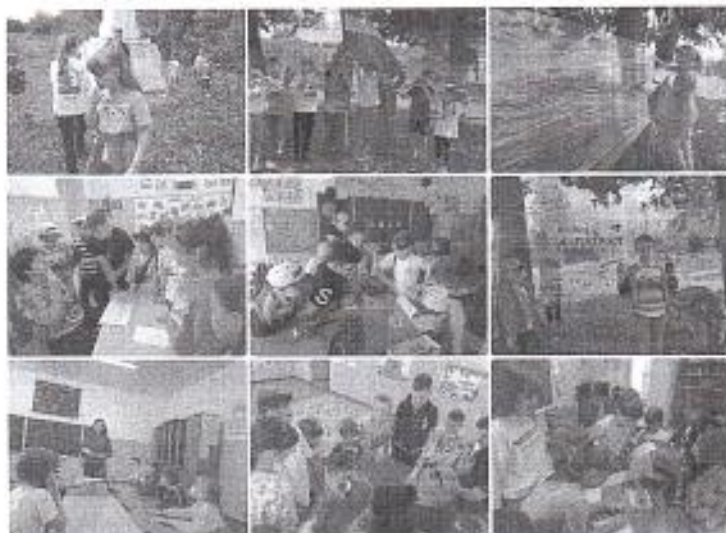
Рис. 10 «Закрытие ЛДП «Юный патриот»