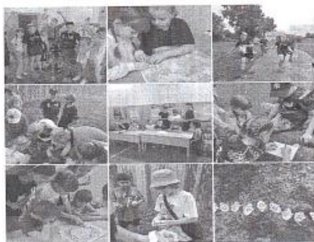
Рис. 4 «Игры по интересам»

Летнее трудоустройство – двойная польза! В школе работает производственная бригада. Ученики трудоустроены благодаря программе, которая помогает подросткам приобрести опыт работы, оформления через службу занятости, получения заработной платы. Трудоустройство подростков – это не просто возможность заработать, это важный шаг в социализации молодежи, формировании активной жизненной позиции и развитии ответственности.