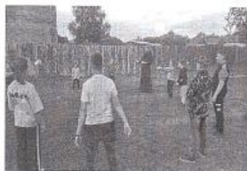
Рис. 9 «Просветительные мероприятия»