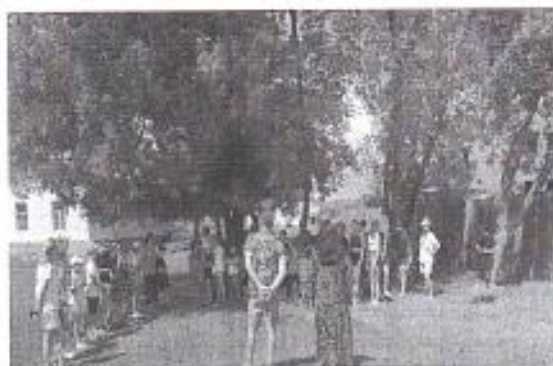
Рис. 2 «Минутки безопасности»

С 3 по 9 июня в ЛДП «Юный патриот» была организована Неделя сохранения здоровья детей. Забота о здоровье ребенка – комплексный и ответственный процесс. Уделяя внимание всем аспектам здоровья детей, воспитатели ЛДП закладывают основу для их здорового будущего.