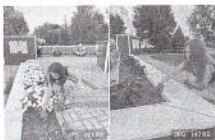
Рис. 5 «Трудовая бригада»

Летнее трудоустройство – двойная польза! В школе работает производственная бригада. Ученики трудоустроены благодаря программе, которая помогает подросткам приобрести опыт работы, оформления через службу занятости, получения заработной платы. Трудоустройство подростков – это не просто возможность заработать, это важный шаг в социализации молодежи, формировании активной жизненной позиции и развитии ответственности.