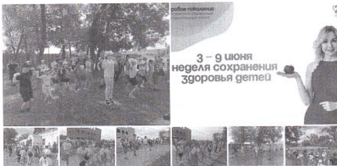
Рис. 3 «Неделя сохранения здоровья детей»

С 3 по 9 июня в ЛДП «Юный патриот» была организована Неделя сохранения здоровья детей. Забота о здоровье ребенка – комплексный и ответственный процесс. Уделяя внимание всем аспектам здоровья детей, воспитатели ЛДП закладывают основу для их здорового будущего.