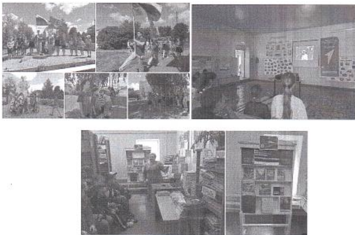
Рис. 8 «День памяти и скорби»

Юнармейцы ЛДП возложили цветы к мемориалу в центре села – Памятнику Неизвестному Солдату.