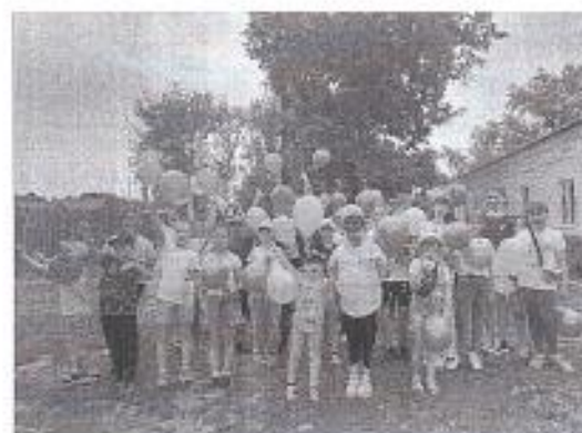
Рис.1 «Открытие лагеря «Юный патриот»»

Воспитателями лагеря были проведены с ребятами инструктажи по пожарной безопасности, электробезопасности, ПДД, на водных объектах, правилах поведения в общественных местах, на железной дороге, во время экскурсий и походов, спортивных мероприятиях.