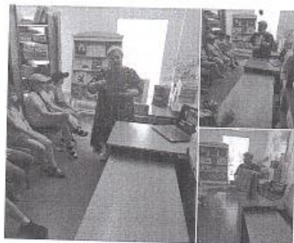
Рис. 6 «День России»

Дети, посещающие школьный лагерь дневного пребывания, приняли участие в международной просветительной акции «Пушкинский диктант».